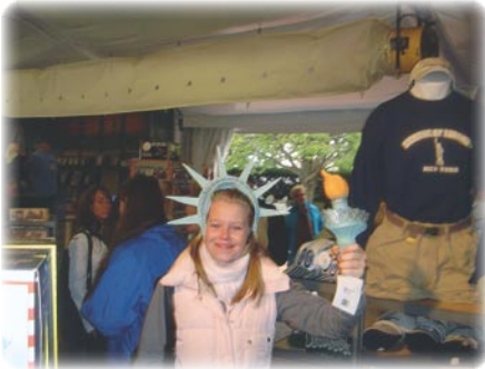
3.G i NY.

og da embedslægen rådede pædagogerne til at afbryde turen og tage hjem, sluttede turen desværre meget brat.