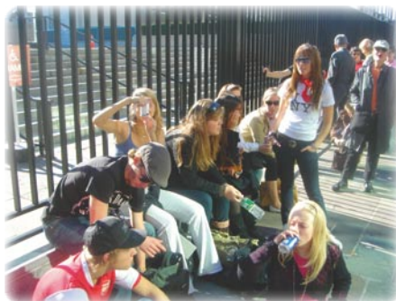
3.G eng. NY.

Sidste år slog vi alle rekorder, så der er noget at leve op til i år.