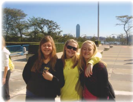
3.G i NY.

I min beretning kom jeg ind på alle de nye tiltag, der sker i skoleverden i disse år.