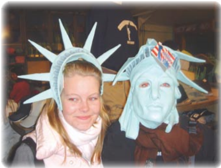
3.G eng. NY.

Der var også fuld opbakning til skolens holdning til dresscoden på NGG, der går ud på, at alle bør være anstændigt klædt.